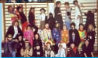
Volksschule St. Peter/Schulchor

Der Schulchor der VS St. Peter ist mit dem Zirkus Morio auf Tournee. „Move and Dance“ wird von der 4b-Klasse dargeboten.