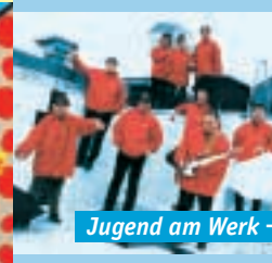
Jugend am Werk – „Origo“

Mit Spaß und Freude am Musizieren wird das kreativ-schöpferische Potenzial der Bandmitglieder in Liedern verarbeitet und mit ebenso viel Engagement aufgeführt.